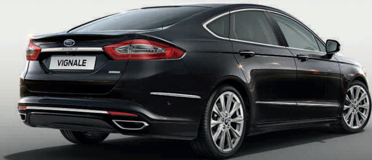
Ford Mondeo Vignale de 4 portas.