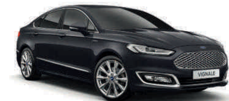
Vignale Black Cor metalizada*