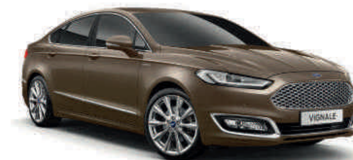
Vignale Nocciola Cor metalizada especial com três camadas*