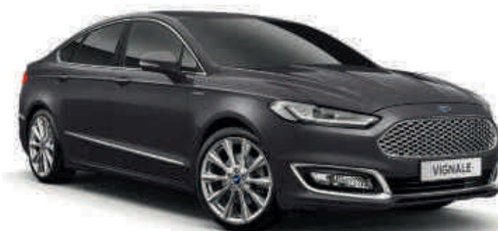
Vignale Silver Cor metalizada*