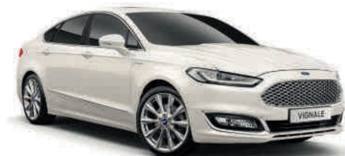
Vignale White Cor metalizada especial com quatro camadas*