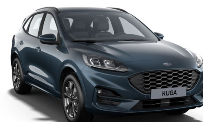
Chrome Blue Cor da carroçaria metalizada*