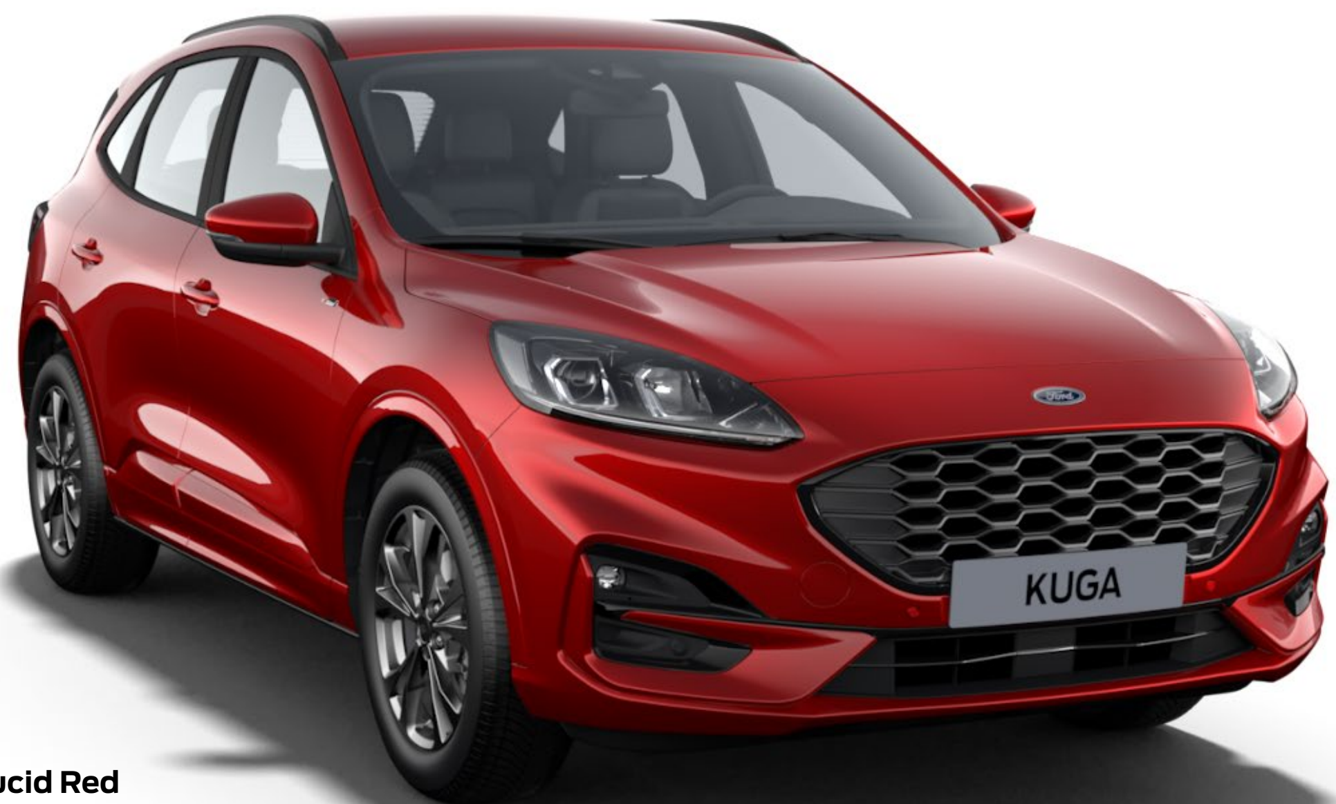
Lucid Red Cor da carroçaria metalizada com camada transparente fumada*

O Ford Kuga deve o seu exterior elegante e resistente a um processo de pintura especial de várias fases. Desde as secções da carroçaria em aço injetados com cera à camada superior de proteção, os novos materiais e processos de aplicação garantem que o novo Kuga irá manter o seu bom aspeto durante muitos anos.