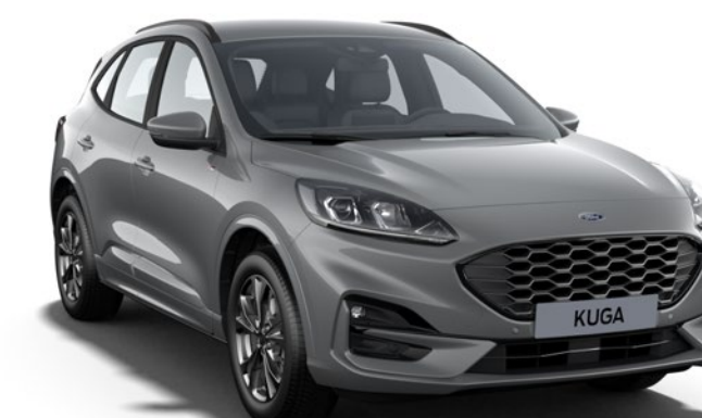
Solar Silver Cor da carroçaria metalizada*