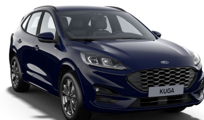
Blazer Blue† Cor da carroçaria sólida