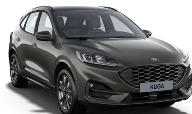
Magnetic Cor da carroçaria metalizada*