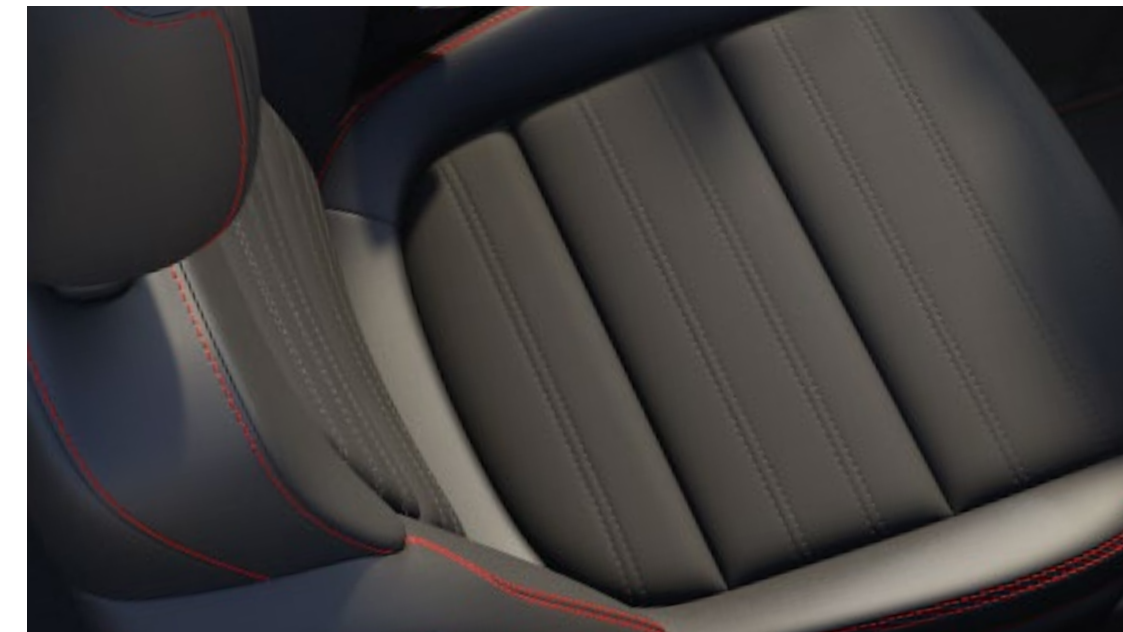
Estofos tecido Rapton/couro sintético Sensico® De série na versão ST-Line X*