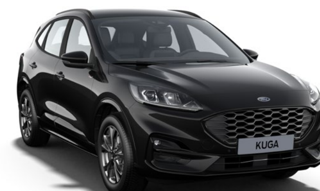
Agate Black Cor da carroçaria metalizada*