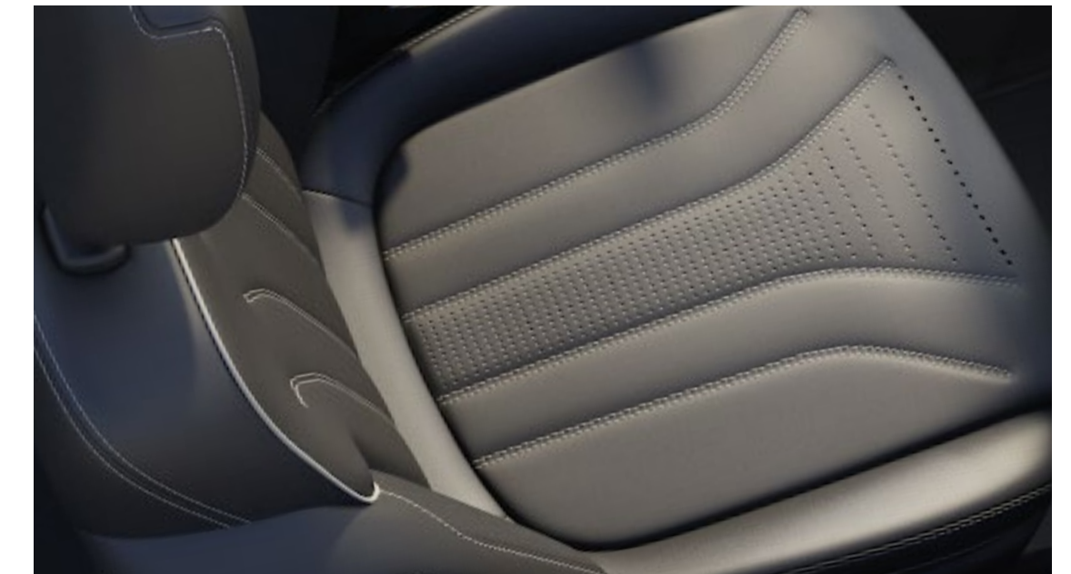
Pele Windsor Arona Perfurada em Ebony/Pele Windsor em Ebony De série no Vignale

*Disponível com ajuste de 10 posições do banco como opcional extra na versão ST-Line X.