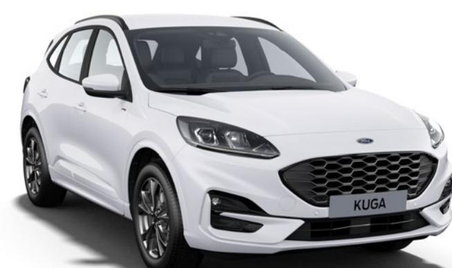
Frozen White† Cor da carroçaria sólida