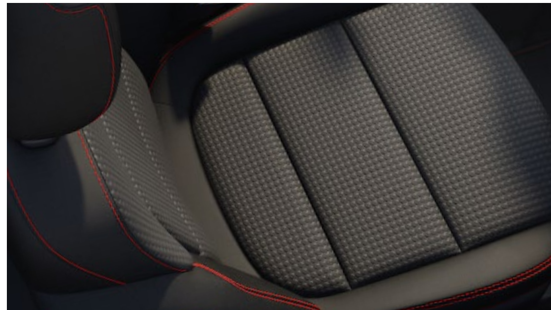
Foundry em Ebony/Eton em Ebony De série na versão ST-Line